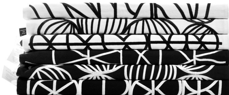
オリジナルファブリックデザイン