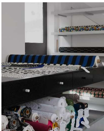
オリジナルファブリックデザイン